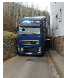
Passeig abans, ara és per a tot. 3 hores atrapat