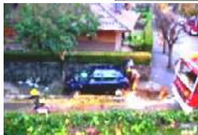
Víctimes: arbre, farola i jo, si hi hagués estat