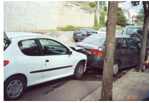
L'Air Bag va ser la salvació de la "xofe