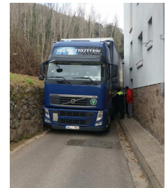
Passeig abans, ara és per a tot. 3 hores atrapat