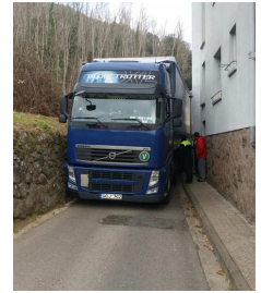
Passeig abans, ara és per a tot. 3 hores atrapat Recuperem