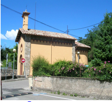
Capella de la Mare de Deu dels Desemparats