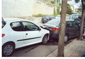
'Air Bag va ser la salvació de la "xofer"