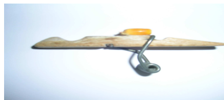
Situació del projectil, (un gra de blat de moro

4- transformació d'una pinça primera operació