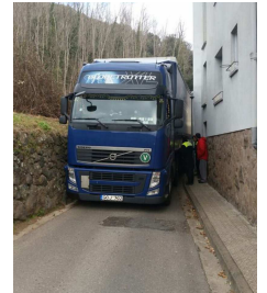
Passeig abans, ara és per a tot. 3 hores atrapat