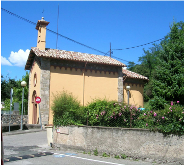
Capella de la Mare de Deu dels Desemparats