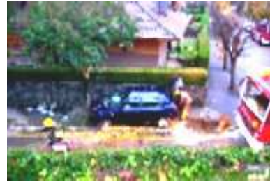
Víctimes: arbre, farola i jo, si hi hagués estat