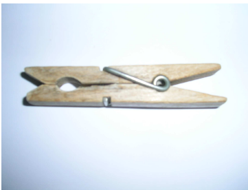
agulla d'estendre roba

L'ambient de postguerra ens impulsava a fer la guerra i ens inventàrem els nostres ginys de guerra . Pistoles de ganxets – molt perilloses --, petits ginys fets amb pinces d'estendre la roba, tiragomes i fins i tot armes i municions reals que trobàvem abandonades arreu. Molts barris tenien el seu exercit infantil i les batalles solien ser freqüents.